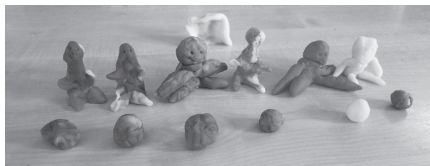
Een heel gezin.