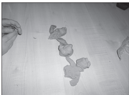
Vader en moeder, en de combinatie